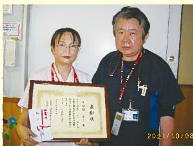
(写真撮影時のみマスクを外しております)