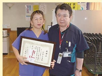
(写真撮影時のみマスクを外しております)

あっという間に時間が過ぎる中で、長年看護の仕事をしてきましたが、院長先生をはじめとする数多くのスタッフの皆さんや、患者さんからの支えのおかげで、今回素晴らしい表彰を受けることができました。今後も、笑顔と感謝を忘れずに、一生懸命頑張っていきたいです。本当にありがとうございました。