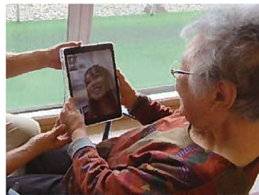
リモート面会 (啓明園食堂ホールで)