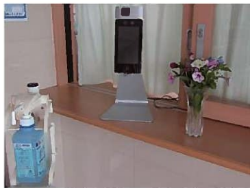
顔認証型体温計 (玄関にて)