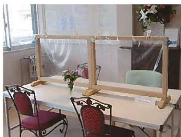
玄関 エントランスホール

近隣のご家族は来園され、窓越しで面会を行っていますが、遠方のご家族は来園が難しい為、当施設ではタブレット端末等の、カメラ機能を利用したリモート面会を行っています。