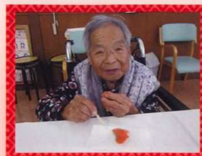
「わっぜかうんまかよー。」

昨年のお茶会は規模を縮小して開催されました。職員は慣れない和服を着て挑みました。職員も入居者様もいつもと違う、会場や雰囲気緊張気味でしたが徐々に入居者様の顔も綻び、満面の笑顔でもみじの和菓子とお抹茶を楽しまれました。