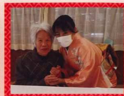
「もう一回お嫁に行けるよ。」