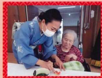
「食べやすくしてくいやっど〜。」