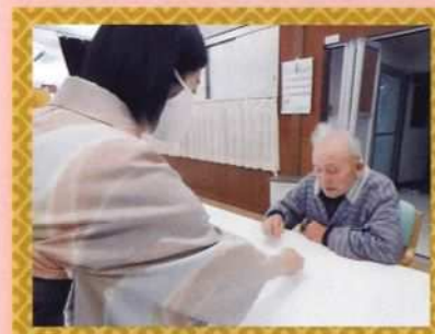
「なんのうんまかもんじゃろかい。」