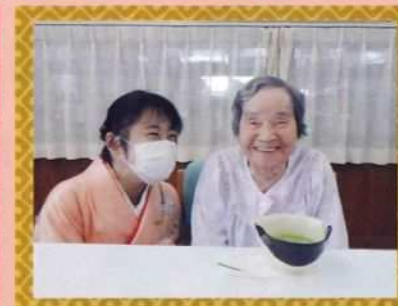
「今日は良か日じゃなあ〜、長生きはするもんじゃ〜。」