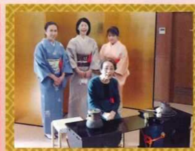
園長と和服姿の職員